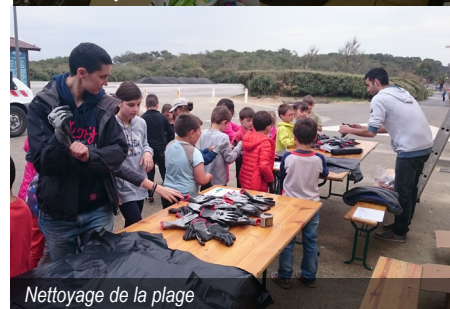
Nettoyage de la plage