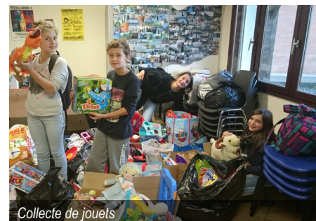
Collecte de jouets