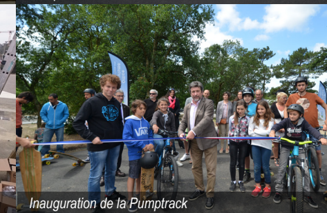
Inauguration de la Pumtrack