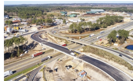
Échangeur n°8 (Capbreton)

Suite au raccordement des nouvelles bretelles sur le pont de l'échangeur, la démolition du pont des anciennes bretelles est programmée.