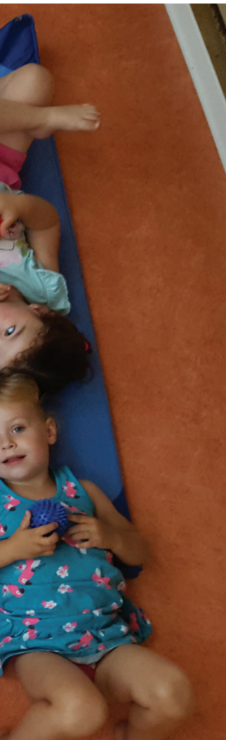
Haut: séance de retour au calme après une activité de psychomotricité. Massage avec les balles à picots