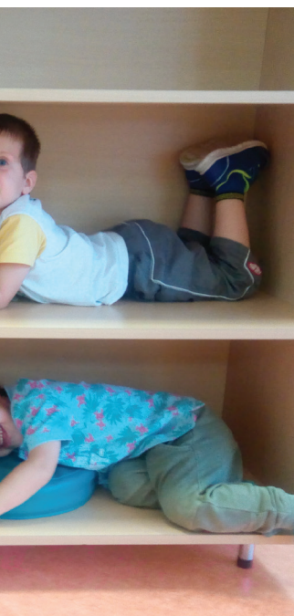
Bas : jeux libres